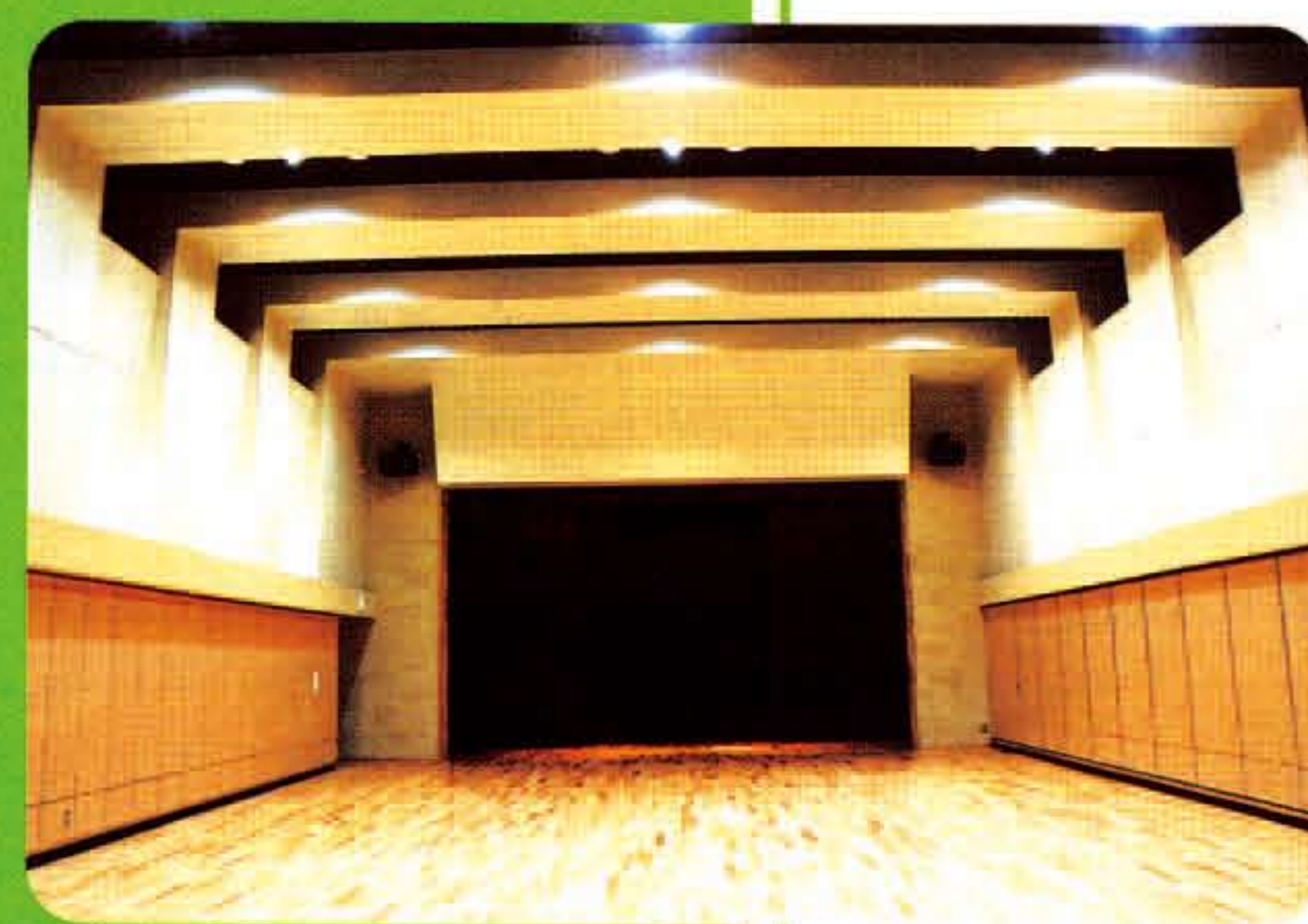
音響設備も整った多目的ホール