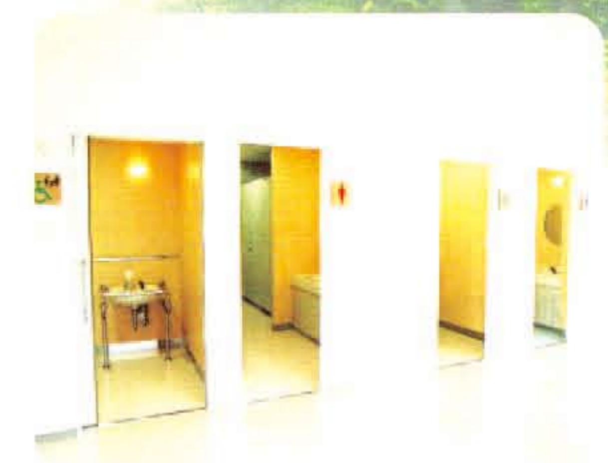
ユニバーサルデザインを取り入れたトイレ