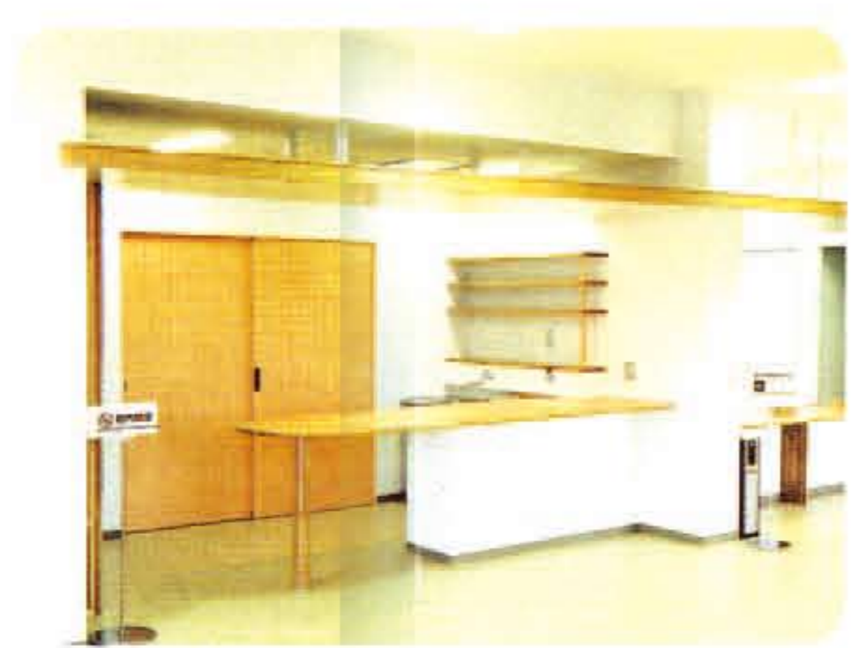
軽食も可能な喫茶室