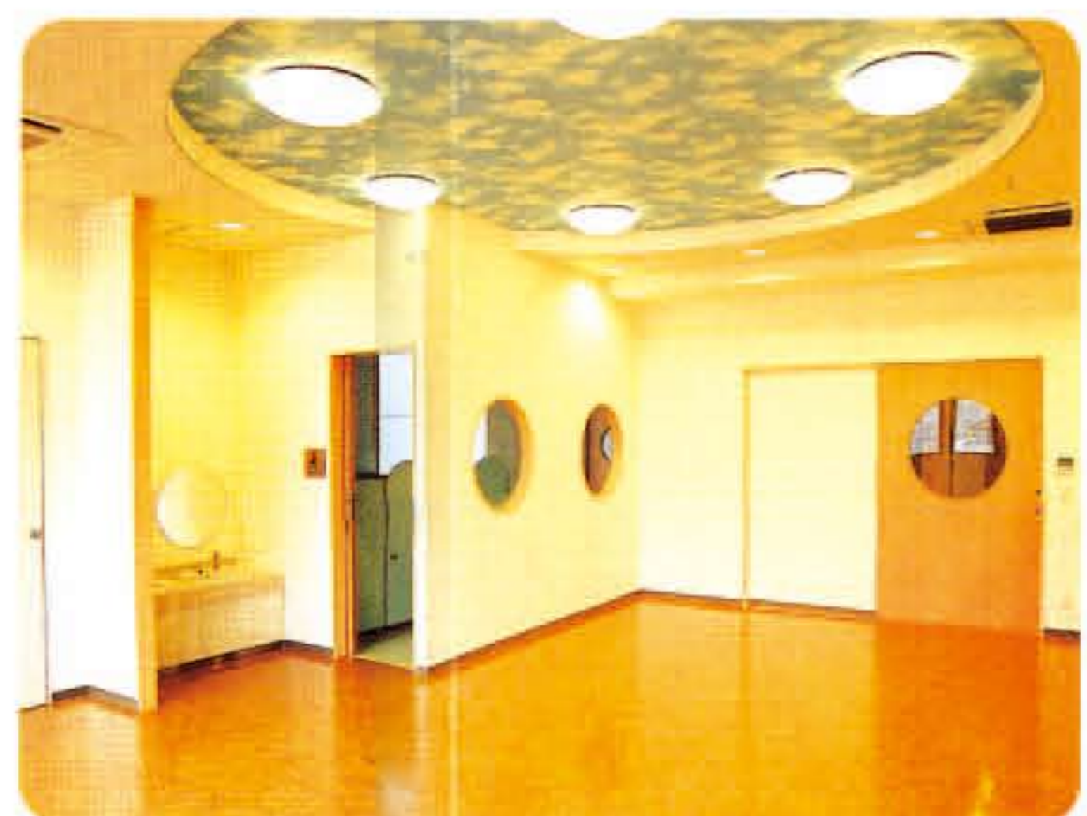
子育て交流サロン