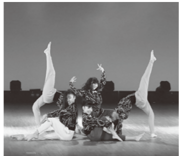
グランプリ: RED PANTHER