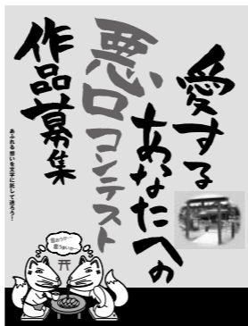
※詳細は4ページをご覧ください