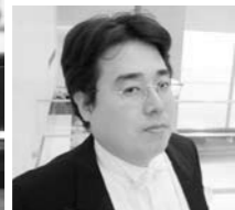
中原朋哉、指揮 シンフォニエッタ 静岡 芸術監督