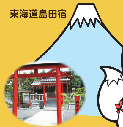
東海道島田宿御陣屋稲荷神社 (別名:悪口稲荷)